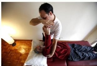
Tratamiento fisioterapéutico para el alzheimer. Tratamiento fisioterapéutico para alzheimer pdf.